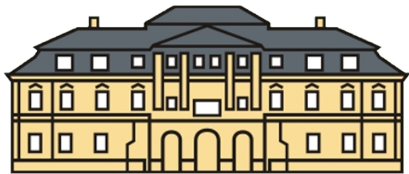
ODBORNÉ UČILIŠTĚ CHROUSTOVICE, ZÁMEK 1